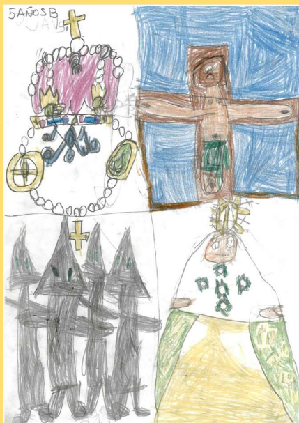
Infantil 5 Años B: J.S.V.