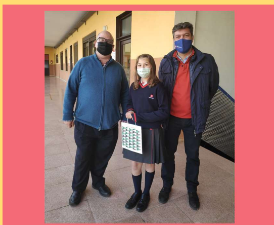
PRIMARIA 5ºB M.G.A.