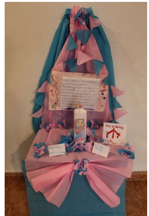
PREMIO CATEGORÍA ALTAR T.G.J. 1º A Primaria