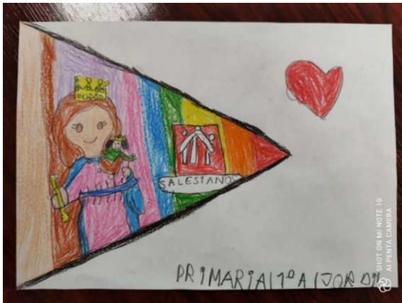
PREMIO CATEGORÍA DIBUJO: J.G.R. 1º A Primaria

Coincidiendo con la celebración del 24 de mayo, la AMPA organizó el primer concurso de dibujos y altares de María Auxiliadora. Se planteó la participación individual en los niveles de infantil, primaria y secundaria, y a nivel de grupo en postobligatoria. El jurado valoraría la originalidad, la creatividad artística, así como los detalles relacionados con el tema. Los ganadores fueron: