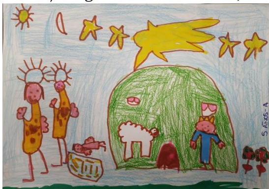
Ganador Infantil. 5 Años A

Más de 700 alumnos han participado en esta 1ª edición del concurso de felicitaciones de Navidad organizado por la AMPA. Los profesores del colegio han colaborado realizando una primera selección, dejando unos 60 como los candidatos a valorar por un jurado conformado por miembros de la Junta de AMPA. Este jurado ha seleccionado una felicitación ganadora por cada etapa (infantil, primaria y secundaria). La ganadora de Primaria, de 5ºB, será la que el Centro utilice como felicitación “oficial”.